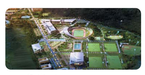
국군 체육부대 조감도