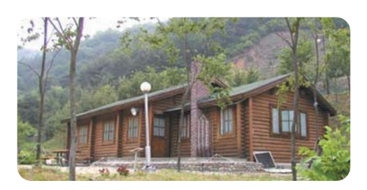
불정자연휴양림은 융단처럼 펼쳐진 소나무, 잿나무에서 뿜어져 나오는 피톤치드 덕분에 신선한 공기를 늘 접할 수 있다.