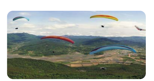
항공레포츠의 메카로 지리잡을 문경활공랜드는 편리한 교통망과 접근성이 양호한 전국 최고의 입지여건을 갖 추고 있다.

시민들과 함께 시정을 펼쳐온 지 벌써 3년이 지났습니다. 그동안 열심히 뛰어다니며 노력한 결과 많은 성과를 거뒀 고, 이제 하나하나 그 결실을 맺어 가고 있습니다. 작년에 는 1974년부터 줄던 인구가 34년 만에 증가하는 획기적 인 한 해였고, 국군체육부대, stx리조트 준공, 알루텍, 서 울대병원연수원 등 많은 투자가 이루어졌습니다. 지금까 지 유치한 투자 사업들이 본격적으로 가동되면 올해는 고 용창출과 인구증가로 인해 지역경제에 활력소가 넘칠 것 으로 생각합니다. 최근 우리 시는 '해보자' 가능하다'며 열심히 일하는 분위기로 생동감이 넘치고 있습니다. 저도 항상 '할 수 있다'는 신념으로 관광객 1천만 시대와 인구 8만명 시대를 위해 최선을 다하겠습니다. 저와 함께 문경 시 발전을 위해 애써주신 시민을 비롯한 출향인사 여러분 께 진심으로 감사의 말씀을 드립니다. 앞으로 문경이 전국 에서 가장 살기 좋은 고장으로 거듭날 수 있도록 혼신의 힘을 다 바치겠습니다.